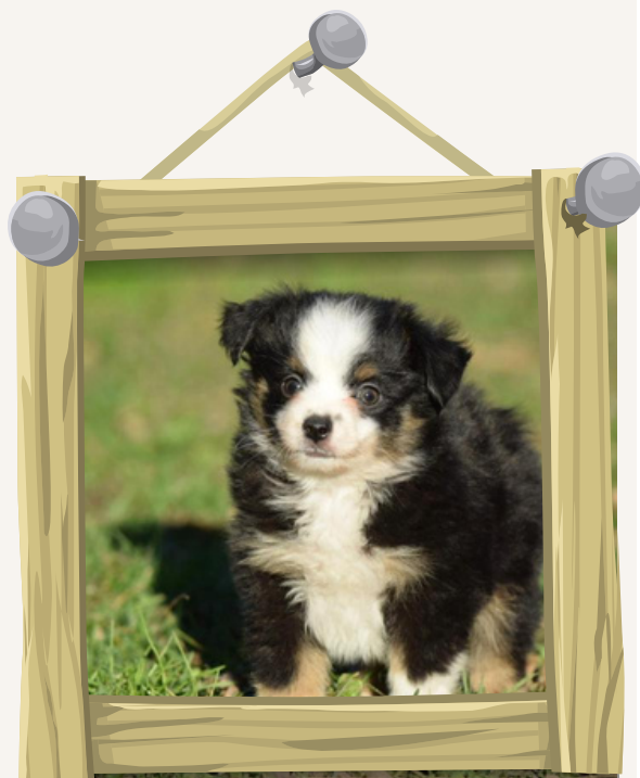
Kalya à 2 mois