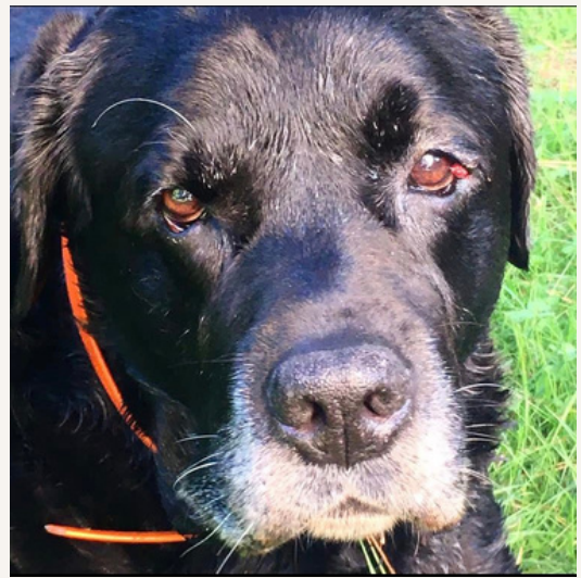
Endy, 14 ans

Ils risquent de glisser, de tomber dans l'eau et n'auront sûrement pas la force de lutter contre le courant.