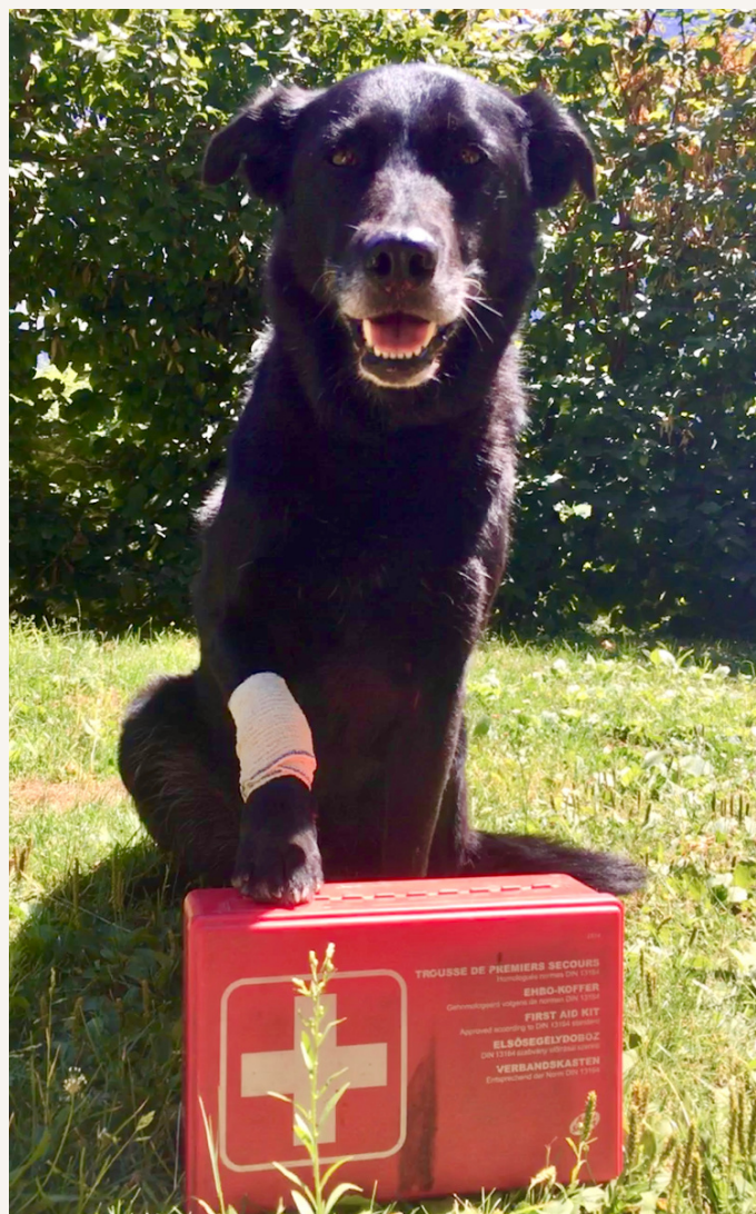
Harley prête à partir