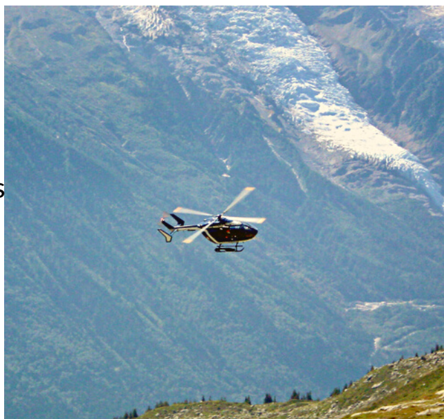
Secours dans le massif du Mont Blanc