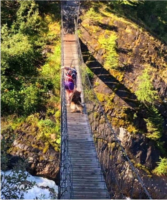
Gypsy sur la passerelle qui surplombe la cascade de Bionnassay

Rassurez votre compagnon, encouragez-le calmement pour qu'il se concentre sur l'endroit où il pose ses pattes.