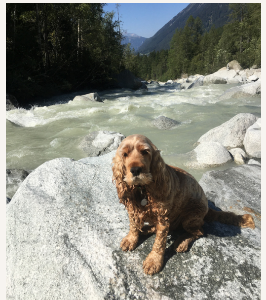
Isidore après la baignade

- Apprenez-lui à aller à l'eau sur commande.