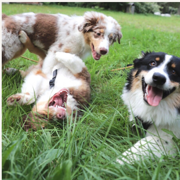
Sky, yoshi et skyounette