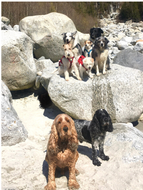
La team en rando

Pour les mêmes raisons, les chiens avec des troubles de la proprioception (conscience du corps dans l'espace), maladroits ou impulsifs sont également à surveiller de près.