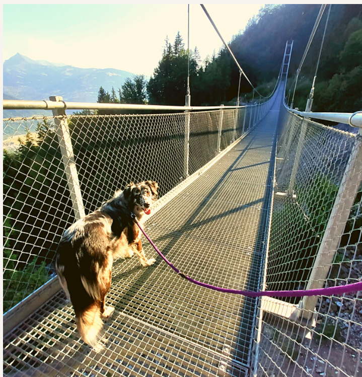
Nasca sur la passerelle de Passy

Saviez-vous que certains chiens sont sujets au vertige? Ils peuvent se bloquer ou paniquer au-dessus du vide.