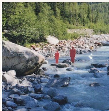
AVANT le lâcher d'eau