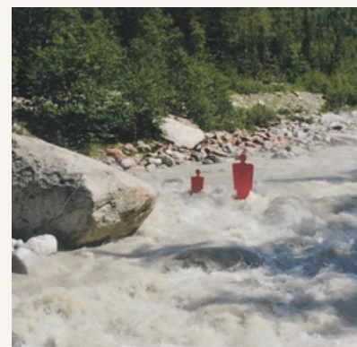
APRES le lâcher d'eau